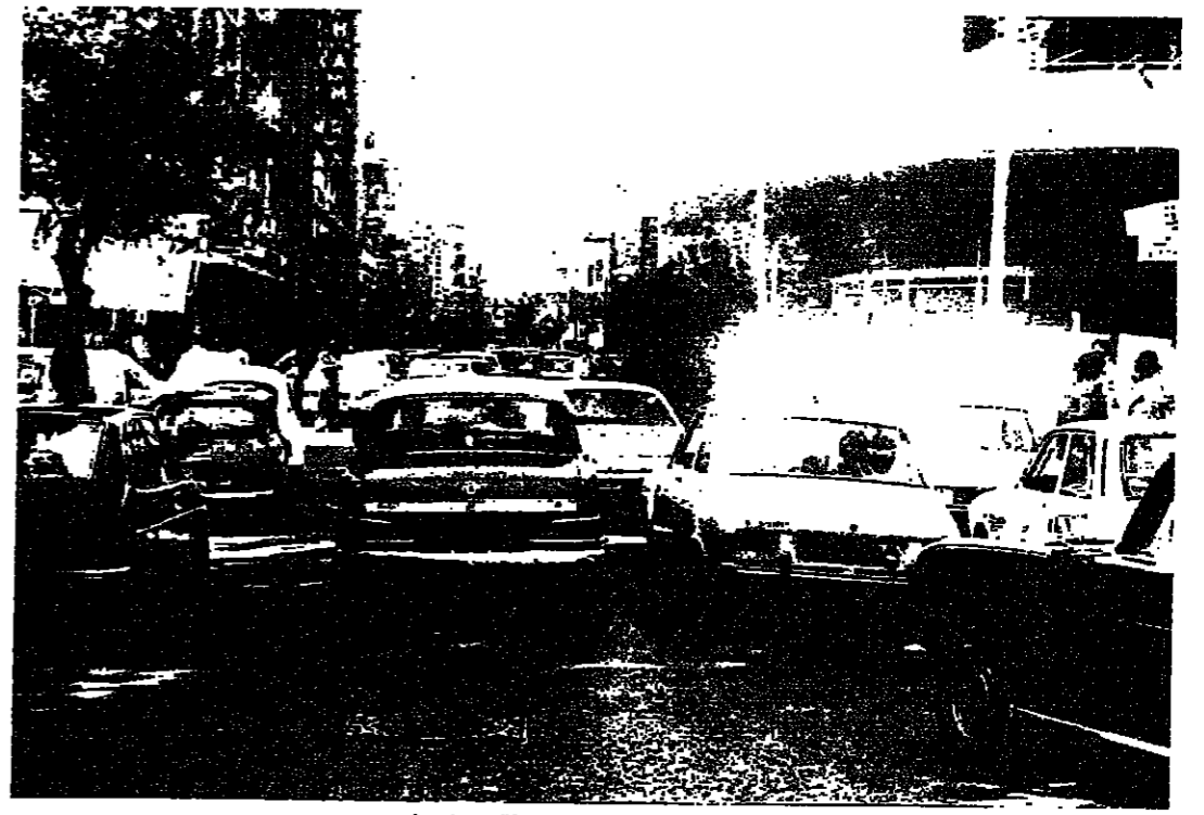
حركة السير في الجزائر بعد انشطة صباح أمس

استمرت محاولات العودة إلى الحياة الطبيعية في مسيرات أمس، بطرق شديدة، بسبب استمرار عمليات الخطف في عدة مناطق، وكذلك الترشق بالتران في الضواحي. وكان الخوف من تجديد عمليات التهرب ظاهرا في أصرار عدد كبير من أصحاب المحلات في المنطقة التجارية على تزيين محلاتهم من محتوياتها ونقلها إلى أماكن سكنهم. وكانت الحركة شبه عادية في شارع الجزائر أمس، وفحصت بعض المحلات التجارية والمطاعم ومقاهي الارصفة، ولكن عند الزواد كان محدودا جدا، واقصر على بضعة أشخاص في كل مقهى.